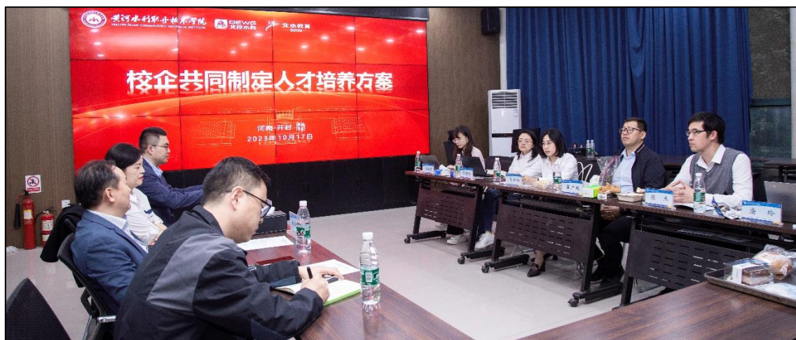
图 1-3 人才培养方案讨论现场

新时代环保教育改革迫切需要建设集课程体系、校企共同进行环境工程技术专业群建设，生态环境工程技术职业本科专业的申报和建设，共同制定人才培养方案。