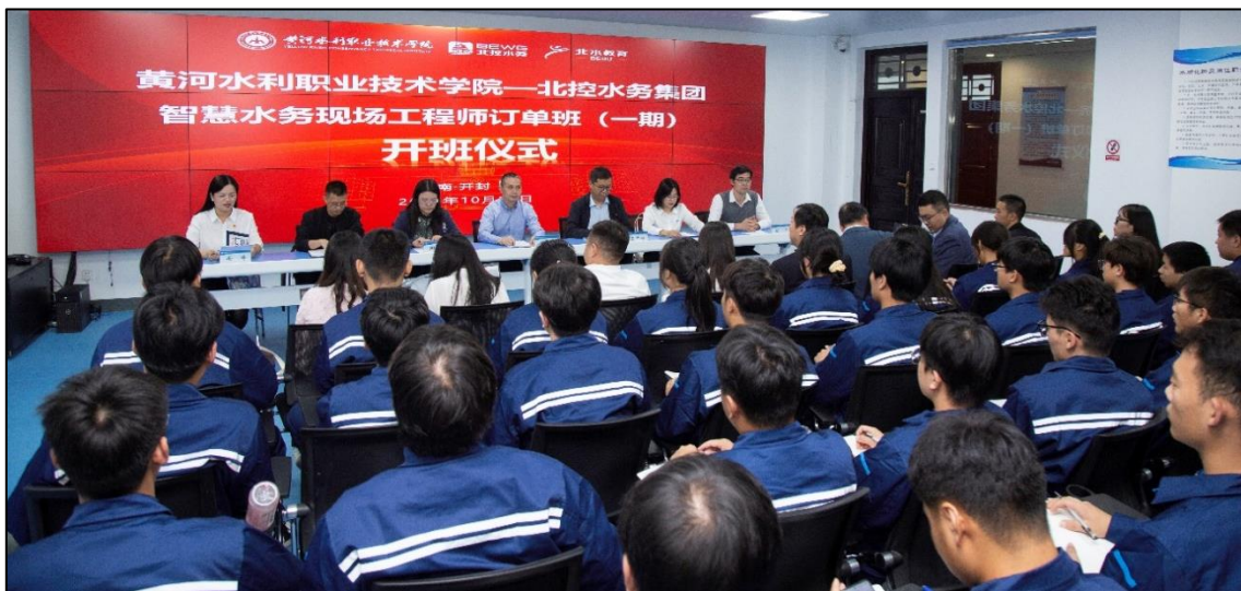
图 1-2 订单班开班仪式

2023年，黄河水利职业技术学院-北控水务集团有限公司首期“智慧水务现场工程师”订单班启动仪式。本次订单班是推进职普融通、产教融合、科教融汇，加快生态环境类高素质现场工程师的培养，促进教育链、人才链、产业链与创新链的有机衔接的重要体现，是全面实践中国特色学徒制，健全校企协同发展新机制，形成技术技能人才紧缺领域系统储能、赋能的环境保护人才培养培训生态的重要举措。