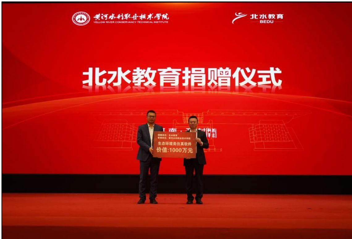
图 1-1 捐赠现场

2023 年北控水务集团向黄河水利职业技术学院捐赠价值 1000 万元的仿真软件。