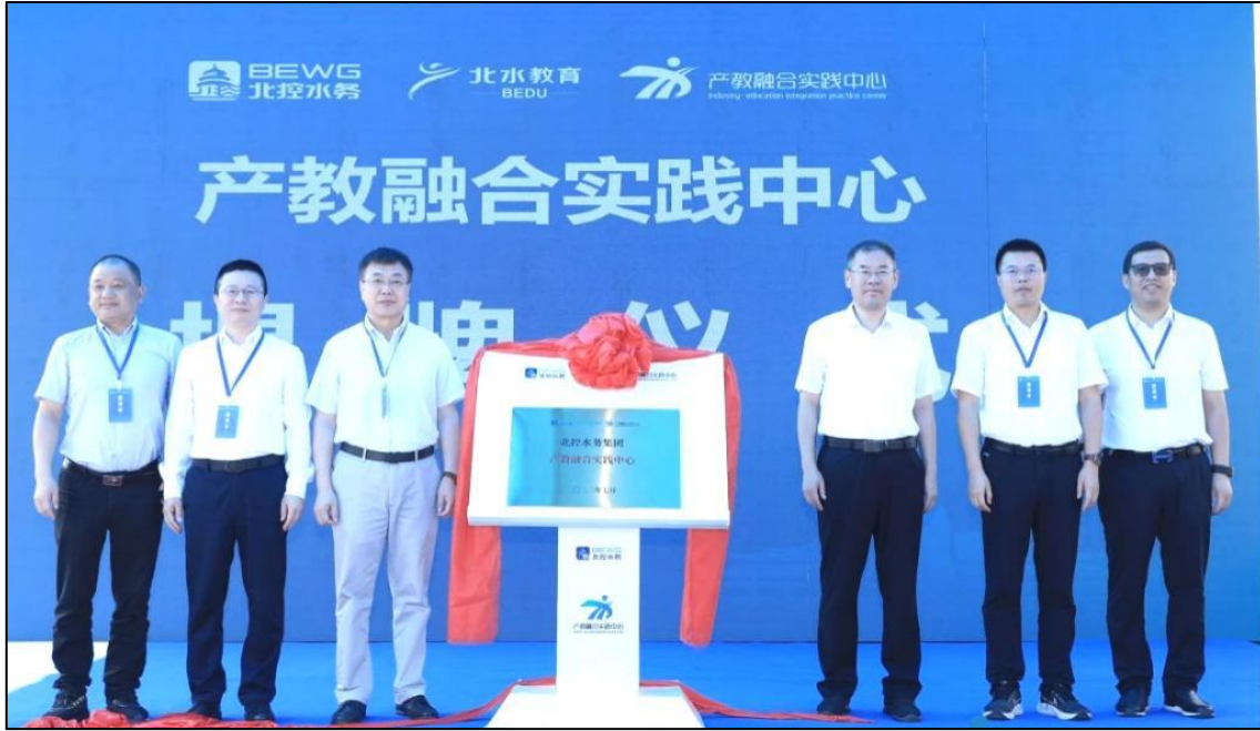
图 1-5 产教融合实践中心成立现场