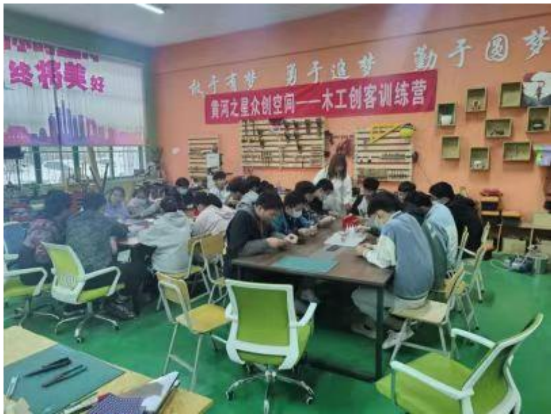
课程思政教学学生开展创新创业实践 2