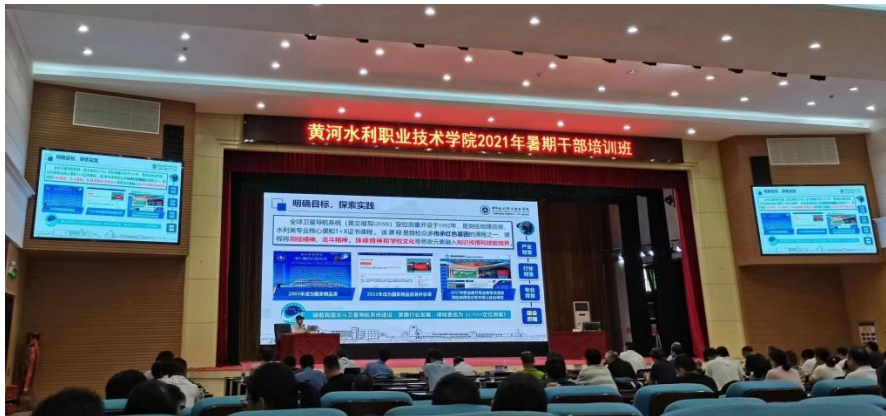
项目组成员参加培训