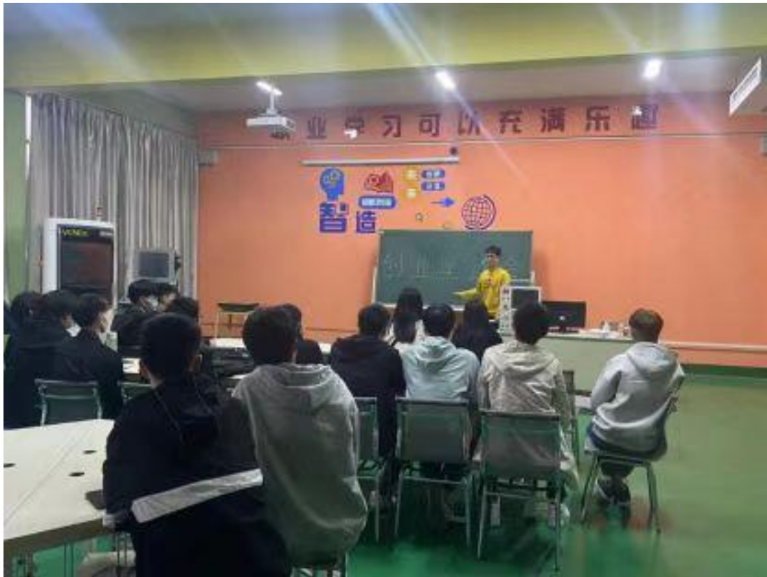
课程思政教学学生开展创新创业实践 1