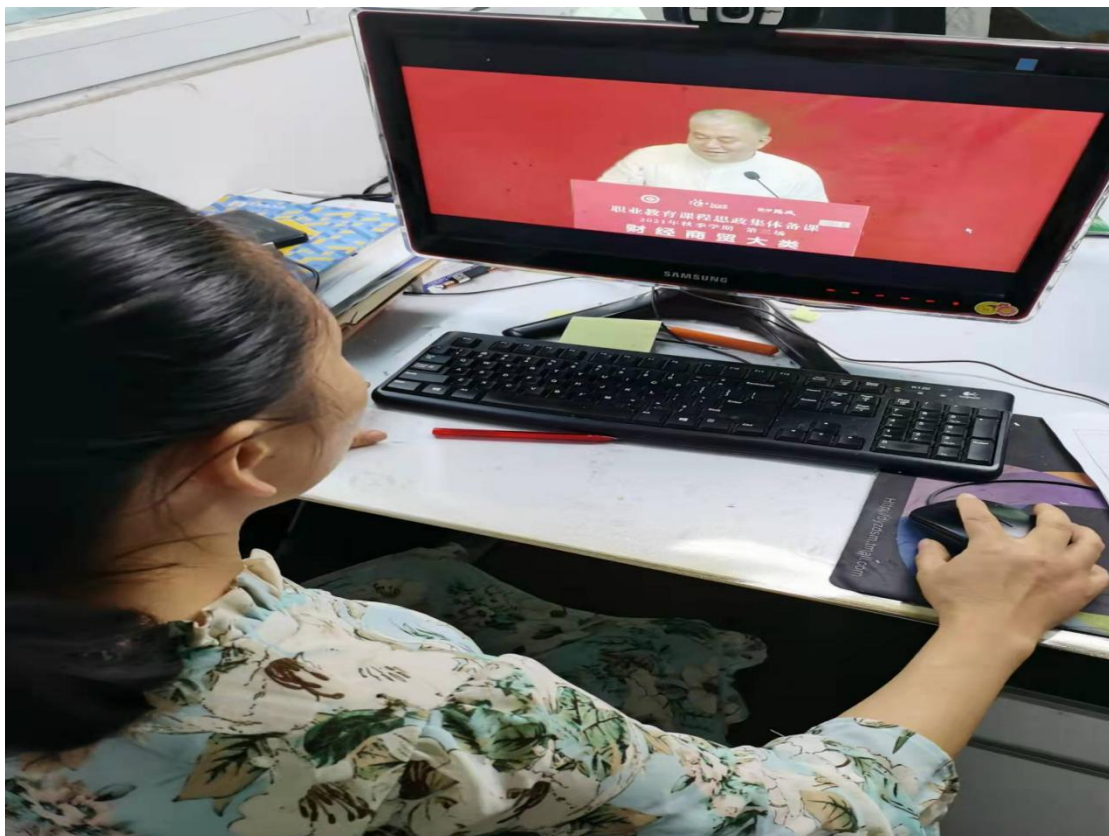
2021.5.26 日参加线上课程思政研讨学习 2