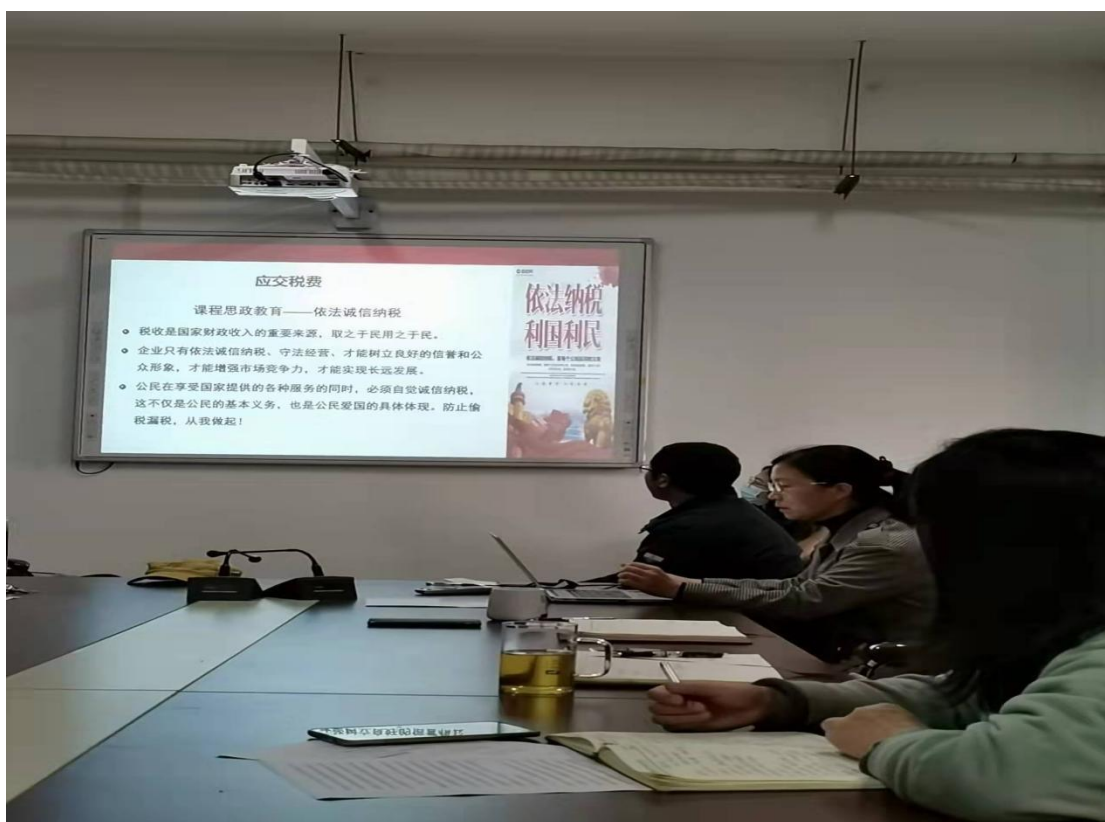
2021.10.16 日 课程思政示范课建设推广汇报 2