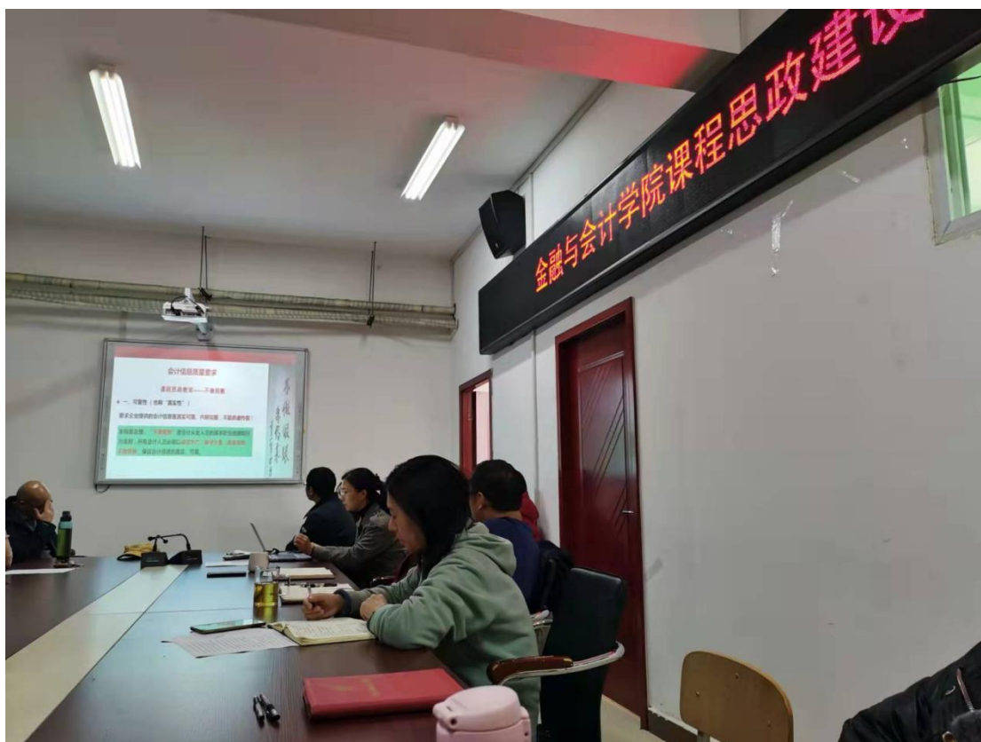
2021.10.16 日 课程思政示范课建设推广汇报 1