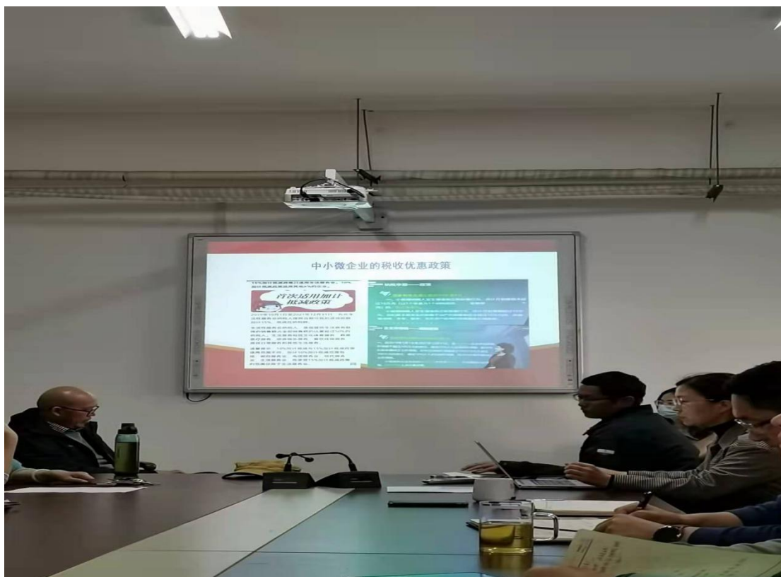
2021.10.16 日 课程思政示范课建设推广汇报 3