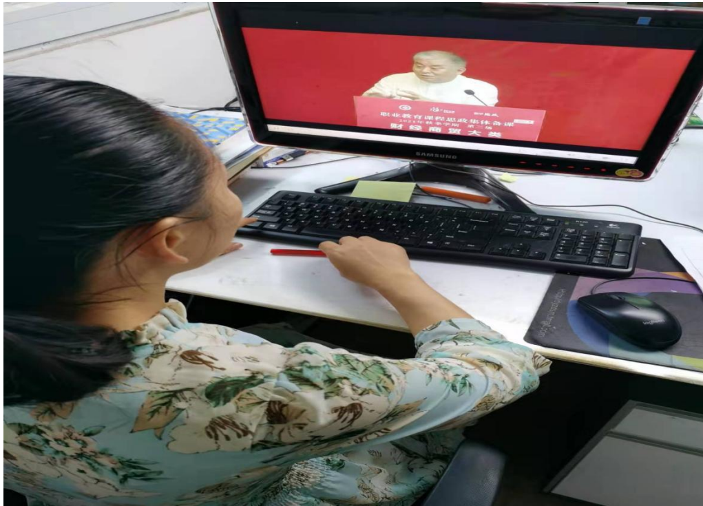
2021.5.26 日参加线上课程思政研讨学习 1